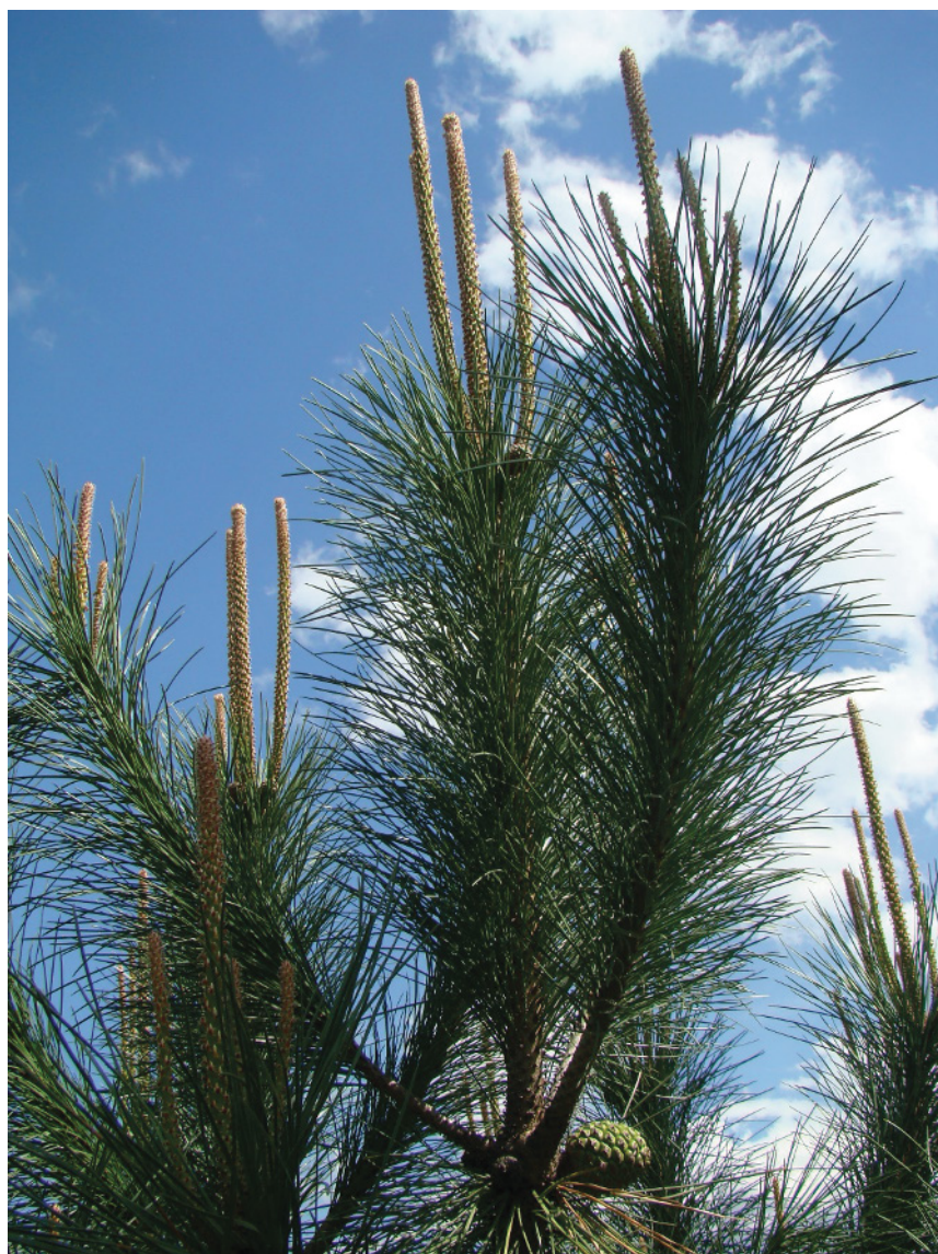
Folha, flor e pinha do Pinheiro Manso

Entre as Serras do Caramulo e da Estrela, em pleno Planalto Beirão, no Concelho de Carregal do Sal, encontra-se em abundância esta espécie de pinheiros, uma das árvores mais facilmente identificadas pelos portugueses.