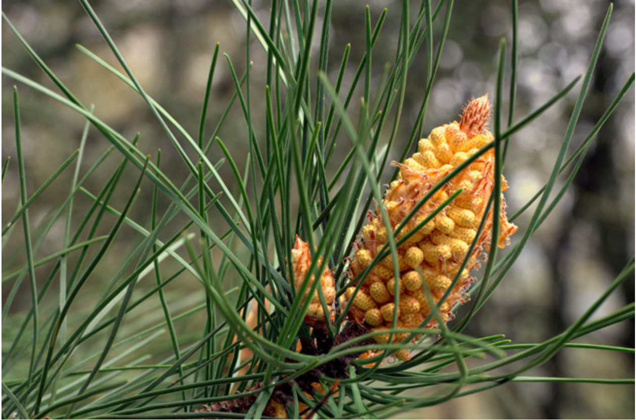
Folha e flor do Pinheiro Manso

As flores masculinas são amareladas enquanto as flores femininas são verdes.