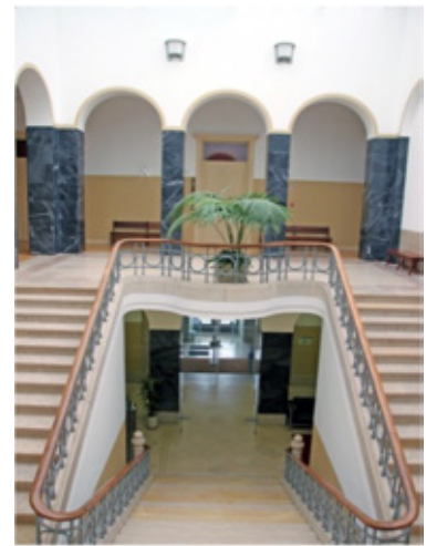
Interior do edifício: arcos e escadaria