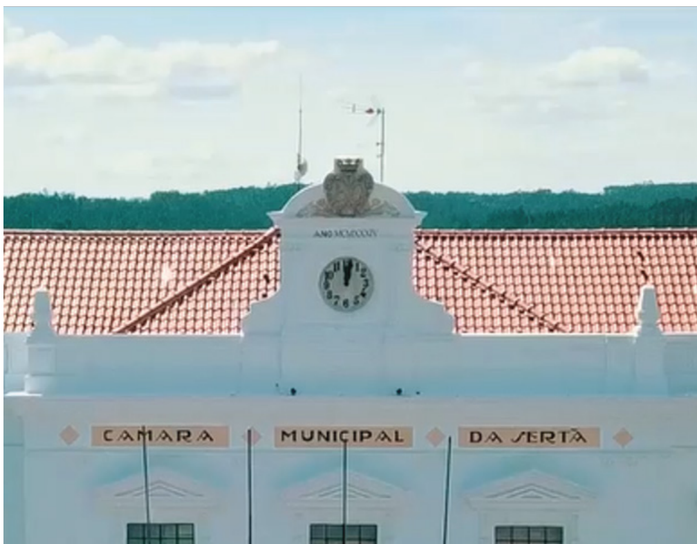
Pormenor do relógio na fachada principal do edifício da Câmara Municipal

O edifício que hoje recebe a Câmara Municipal foi construído de propósito para essa função, ficando pronto em 1934. Mas o seu relógio monumental só começou a funcionar 13 anos depois!