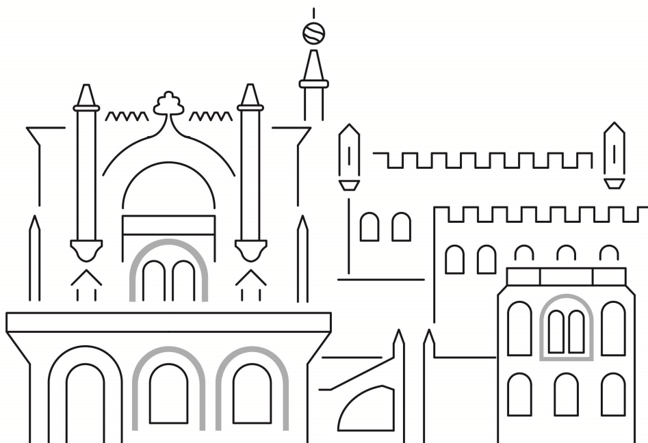
Figura 3 - Palace Hotel do Bussaco

Esta imagem tátil é uma adaptação em relevo de uma fotografia do Palace Hotel do Bussaco. Explique ao leitor que a imagem corresponde à fachada do edifício, e que a sua interpretação é desafiante porque contém muitos elementos. Explique ao leitor que para facilitar a sua interpretação irá omitir alguns destes.