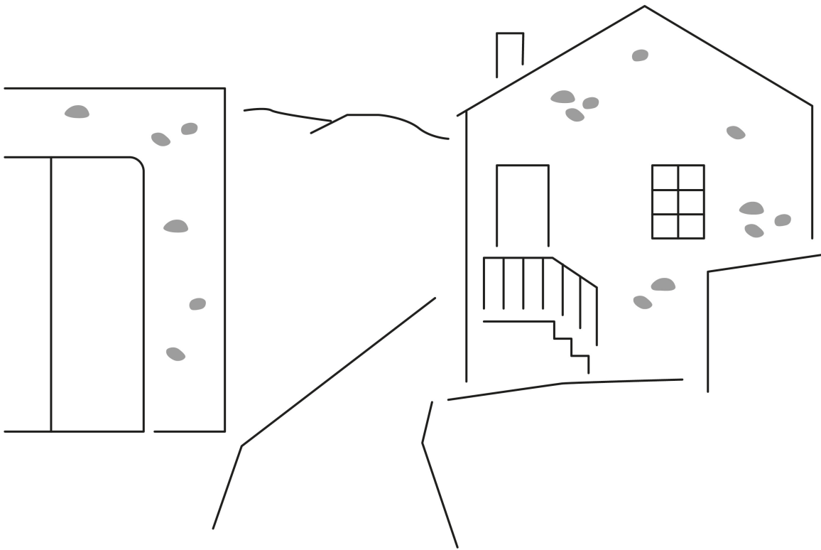
Figura 1 – Gondramaz acessível

Esta imagem tátil é uma adaptação em relevo de uma fotografia do percurso de Gondramaz acessível. Explique ao leitor que o percurso se encontra assinalado no centro da imagem, e que se encontra ladeado por casas.