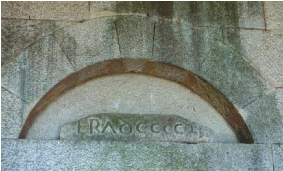
Pedra com o ano de construção da igreja

A igreja foi construída em 912 depois de Cristo. O ano da construção da igreja está marcado numa pedra por cima da porta.