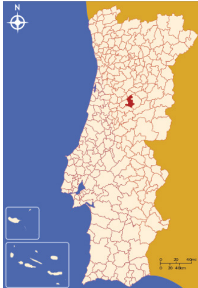
Localização do concelho de Oliveira do Hospital

Lourosa é uma aldeia do concelho de Oliveira do Hospital. Fica na Região Centro de Portugal.