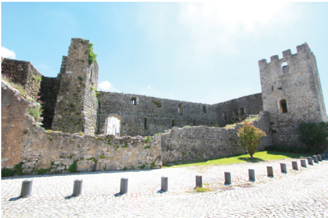
Aspeto atual do Castelo de Soure

O Castelo de Soure é considerado Monumento Nacional, o que faz dele um monumento importante que deve ser protegido.