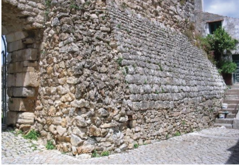
Símbolo da Ordem do Templo

Com o passar do tempo, Soure vai perdendo a sua importância militar, mas, por estar próximo de Coimbra, manteve a sua importância económica, muito por continuar a aproveitar o enorme potencial da água.