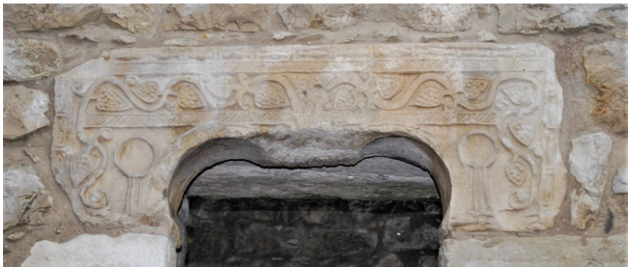
Ajimez – Torre Sul

Podemos apreciar alguns pormenores decorativos do castelo.