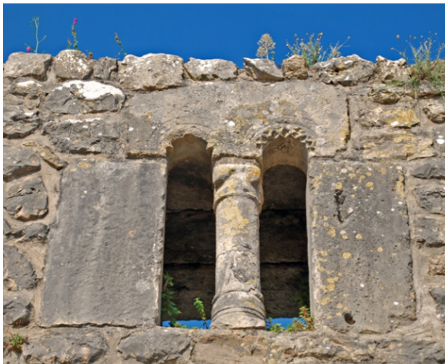
Ajimez – Pano de muralha