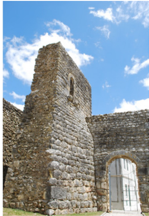
Torre de menagem

O Castelo de Soure é considerado Monumento Nacional, o que faz dele um monumento importante que deve ser protegido.