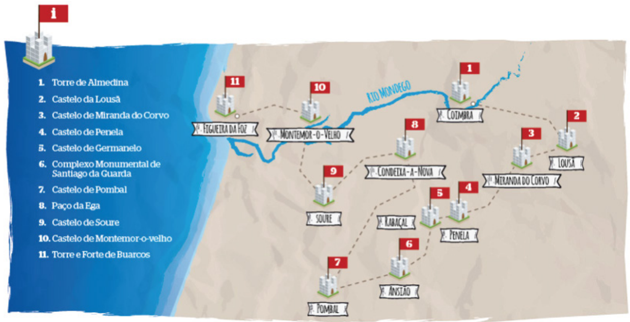
Castelos da linha defensiva do Mondego

Muçulmanos e Cristãos estiveram em luta durante muito tempo. Ora, os muçulmanos ganhavam o território cristão, ora os cristãos reconquistavam o seu próprio território.