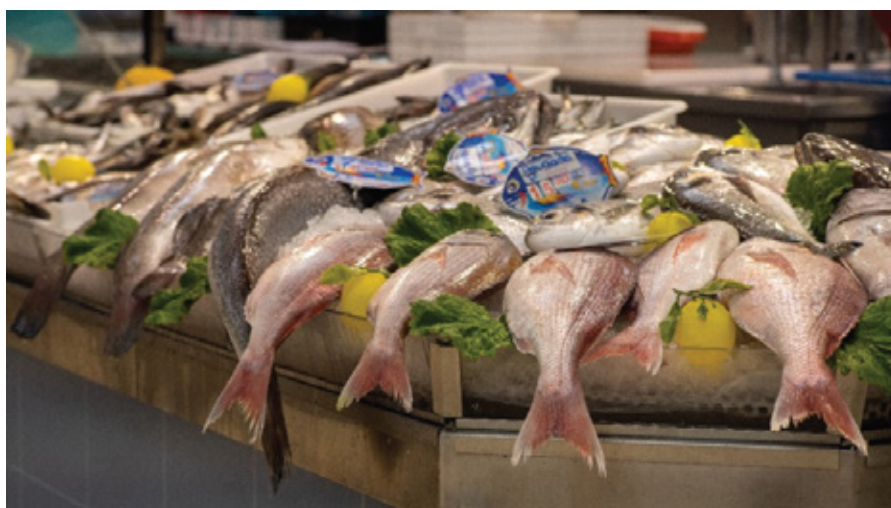
Banca de peixe

Foi-lhe ainda proporcionada a revitalização (mais vida), a dinamização e requalificação da atividade dos operadores retalhistas (vendedores) de produtos alimentares, para atrair novos operadores com outros tipos de comércio, produtos e serviços.