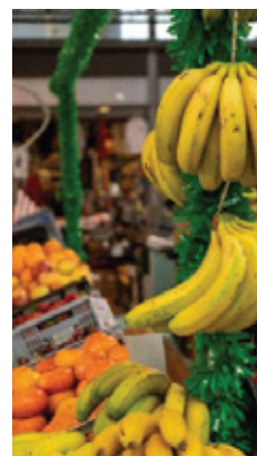
Bancas de fruta