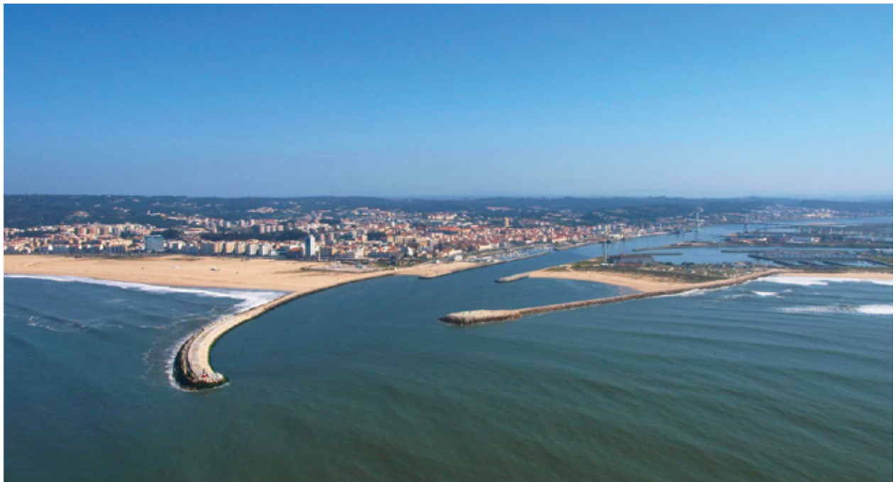
Barra da Figueira da Foz

O Engenheiro Silva nasceu em Lisboa, (16-03-1814) mas mudou-se para a Figueira da Foz para “desassorear a barra”. O engenheiro ia aumentar a profundidade do rio junto à entrada do porto da cidade, tirando terra, para facilitar a entrada dos barcos.