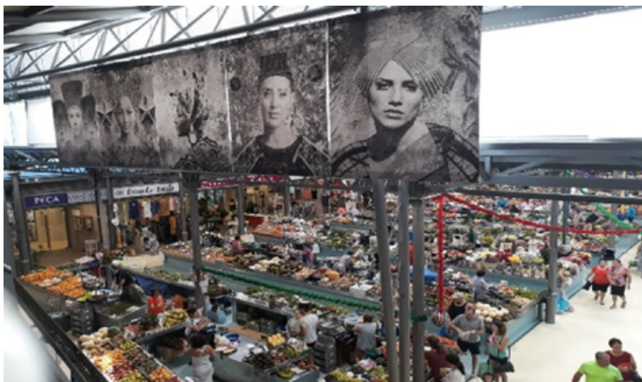
Visão geral do piso 0

O Mercado Municipal é um ponto de encontro de várias pessoas muito diferentes, onde os visitantes gostam de ir. Aqui faz-se a ligação ao mar através do tradicional mercado do peixe. Passam por aqui muitos visitantes, atraídos pelas cores e cheiros próprios, tornando-se local obrigatório no passeio turístico da cidade e da região.