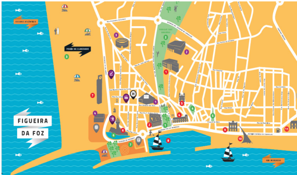
Mapa da barra e da zona ribeirinha da Figueira da Foz

O Mercado foi construído no local da antiga Praia da Fonte, sobre o aterro, onde mais tarde em 1891, também surgiu o Jardim Municipal, dotando esta zona com uma nova frente ribeirinha da cidade.