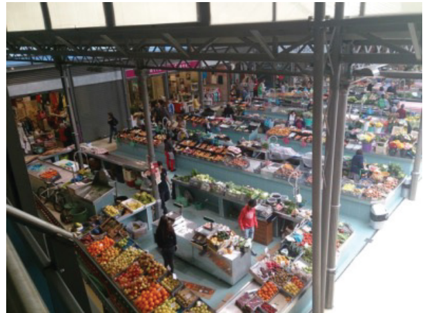
O Mercado Municipal ao longo dos tempos

O Mercado Municipal é um ponto de encontro de várias pessoas muito diferentes, onde os visitantes gostam de ir. Aqui faz-se a ligação ao mar através do tradicional mercado do peixe. Passam por aqui muitos visitantes, atraídos pelas cores e cheiros próprios, tornando-se local obrigatório no passeio turístico da cidade e da região.