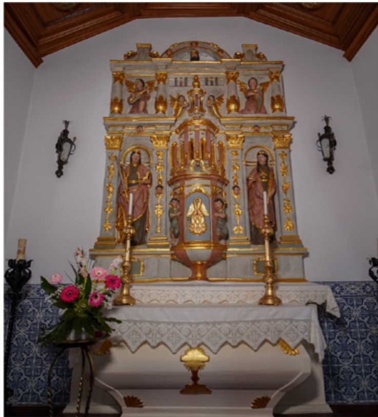
Retábulo na Capela do Sacramento: imagem geral e pormenores