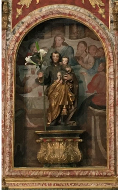
Imagem de S. José

1) no lado esquerdo está a imagem de "São José e o Menino". São José era o pai de Jesus. A pintura atrás representa a última ceia, a última refeição que Jesus comeu antes de morrer.