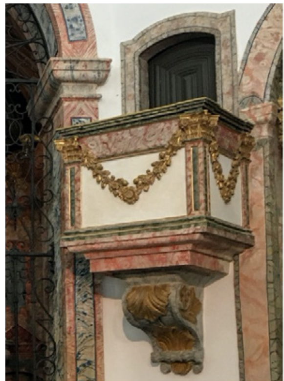
Púlpitos decorados com grinaldas (fitas e flores)

Todos os anos depois da Páscoa, a capela do Senhor dos Milagres recebe uma festa dedicada ao padroeiro.