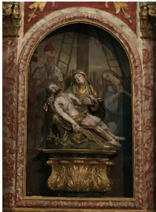
Imagem da Pietá

1) no lado direito vemos a imagem de Nossa Senhora da Piedade (Pietà) com Jesus nos seus braços. Esta cena representa o momento do calvário de Cristo. Atrás está uma pintura que representa o momento em que Jesus é retirado da cruz para depois ser posto no túmulo.