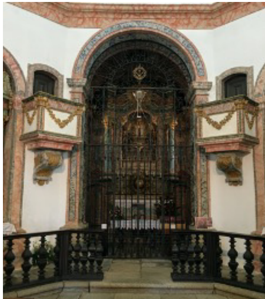
Arco triunfal gradeado

O arco está fechado com um gradeamento de ferro.