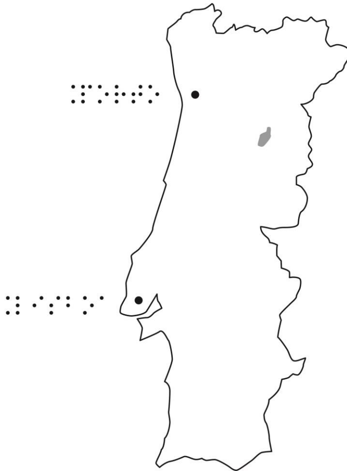
Figura 1 - Localização do concelho de Fornos de Algodres no mapa de Portugal

Nesta imagem está mapeada a localização do concelho de Fornos de Algodres no mapa de Portugal.