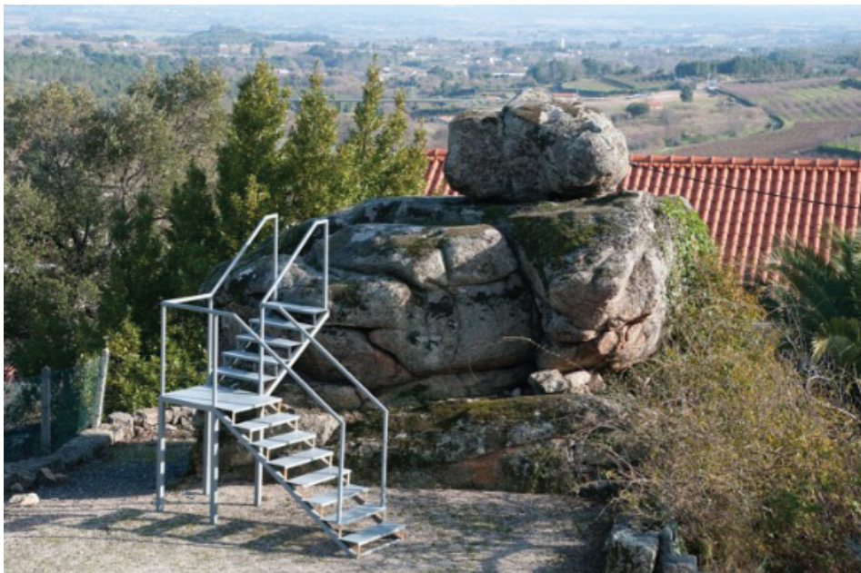
Cabeço da Forca

À saída da aldeia, num pequeno monte, fica o Cabeço da Forca. Era aqui que os condenados pela justiça eram executados, por isso é que há duas caveiras (que representam o símbolo da morte) esculpidas na rocha.