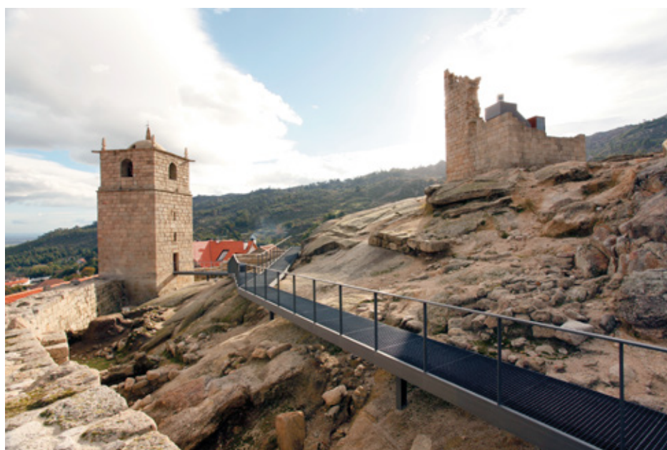
Torre de menagem do castelo

A antiga torre de menagem do castelo já não tem funções militares, mas ainda tem uma função importante - dar as horas!