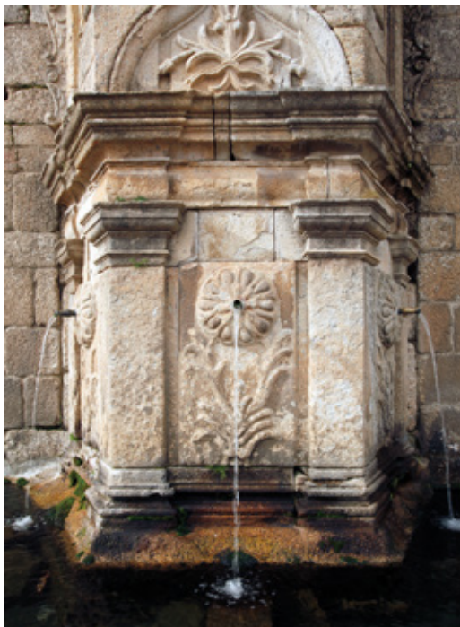
Chafariz de Dom João V