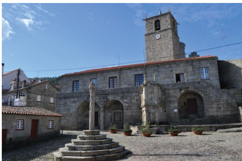
A Praça Paços do Concelho, com o Pelourinho, o chafariz D. João V e os Paços do Concelho