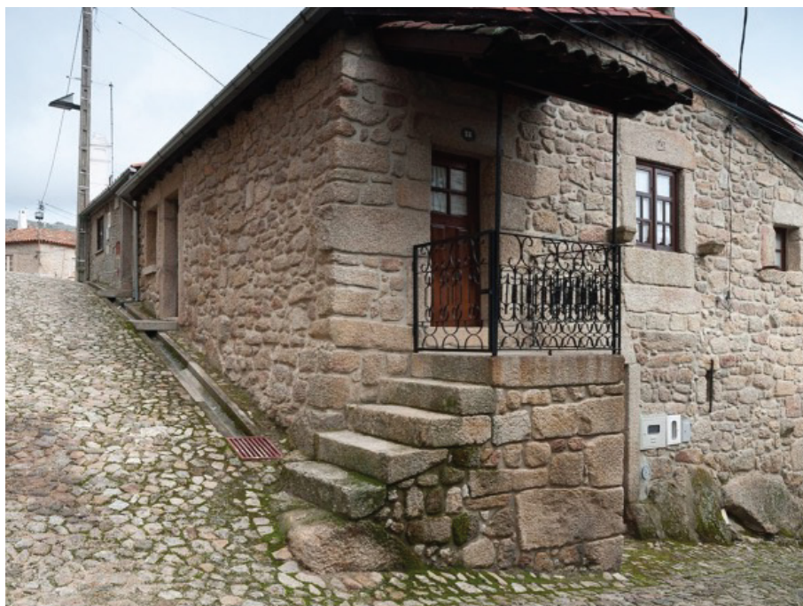
Casa típica beirã

A maioria das pessoas vivia em casas típicas, de pedra (granito), com uma pequena varanda de madeira e dois pisos. A zona de viver ficava no primeiro andar, e a loja ou os estábulos dos animais, eram no piso de baixo.