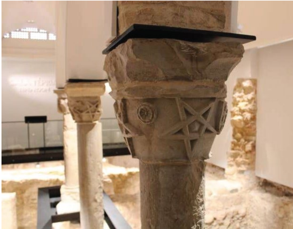
Capitéis das colunas que compõem a colunata norte

O símbolo mais usado na decoração dos capitéis destas colunas foi a estrela de 5 pontas. O seu significado levanta dúvidas, mas em associação com os outros símbolos e por aparecer em igrejas, pode ser um símbolo cristão.