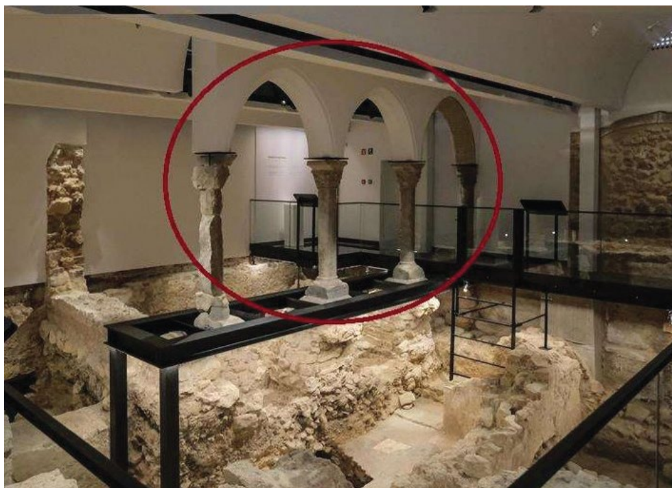
Uma das arcarias da casa da família Barreto

A casa da família Barreto tinha 2 pisos. O piso de cima foi construído sobre um conjunto de arcos feitos com 4 colunas de pedra, tal como se vê na fotografia abaixo.