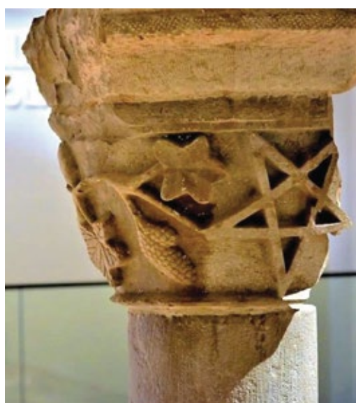
Capitel decorado com símbolos e elementos da natureza

A decoração dos capitéis destas colunas incluía símbolos e elementos da natureza, como flores, cachos de uvas e folhas de videira.