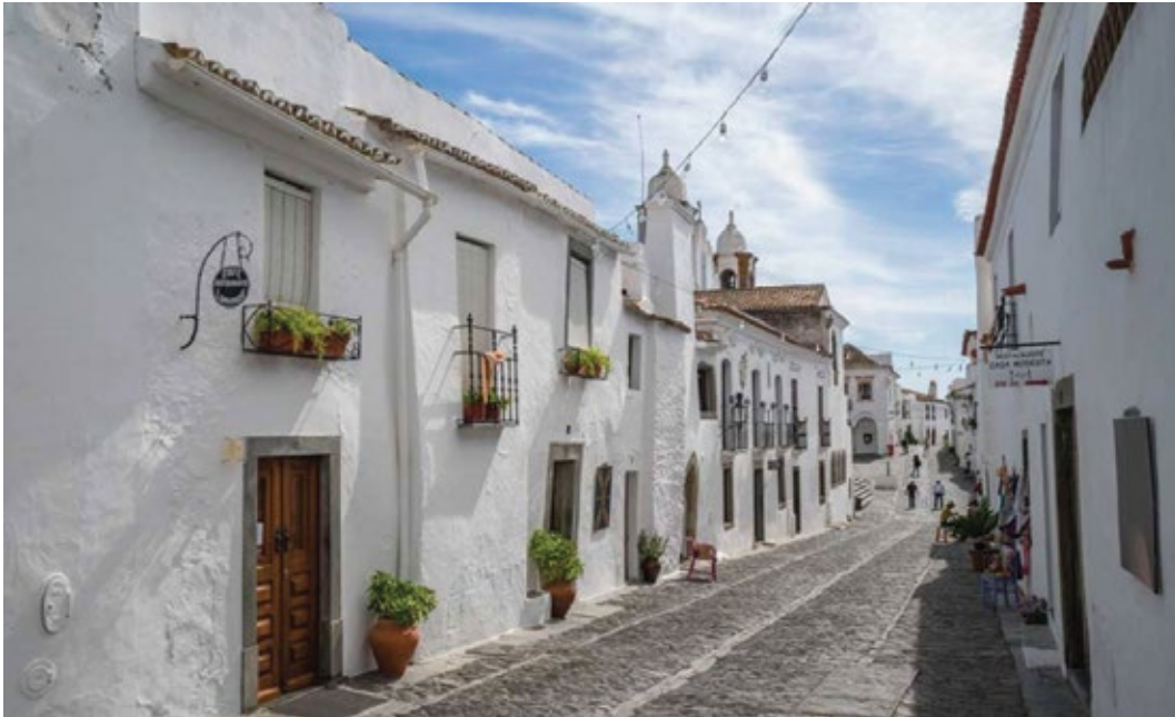
Ruas e casario da vila de Reguengos

As casas, todas brancas, distribuem-se por pequenas ruas ondulantes, com piso de pedra irregular.