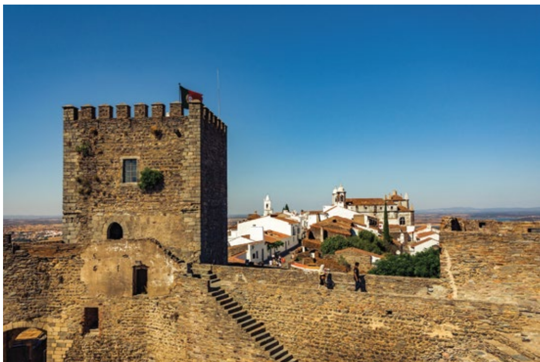
Torre de Menagem

No reinado de Dom Dinis completou-se a barbacã e a Torre de Menagem foi construída. Tem cerca de 21 metros de altura e é conhecida como a Torre das 5 Quinas.