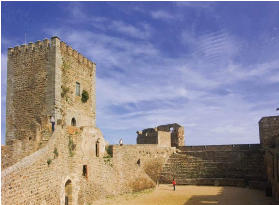
Praça de Armas

A Praça de Armas, uma espécie de pátio ao ar-livre, delimitada por torres. Hoje em dia, a Praça de Armas é muito usada para eventos, como por exemplo concertos, torneios medievais* e recriações históricas.