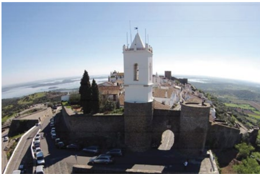
Porta da Vila e cubelos

A Porta da Vila é a porta principal. Tem duas grandes torres arredondadas de cada lado e a forma de um arco pontiagudo. Por cima do arco há um painel de pedra dedicado à Imaculada Conceição.